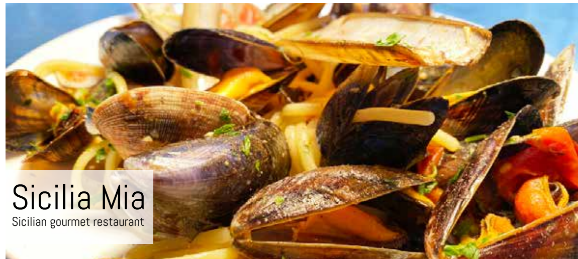
Sicilia Mia Sicilian gourmet restaurant